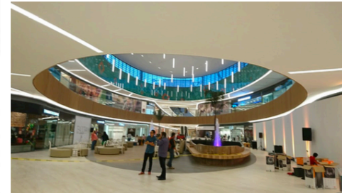
Imagen 1 (Proy.1)

Tipo de obra: CENTRO COMERCIAL Y HOTEL FIESTA INN AMBAR FASHION MALL Monto de construcción en el proyecto: De 50 a 100 millones